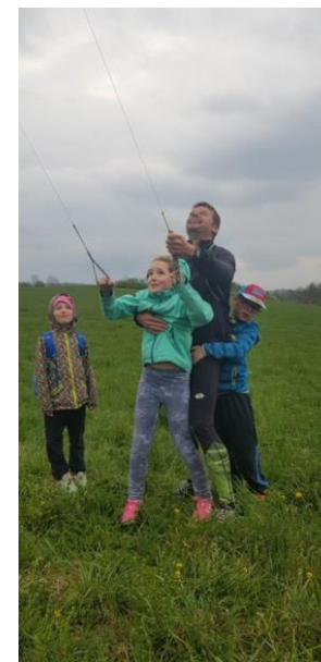
Krásné prázdniny a hlavně sportu zdar!

Nyní nás už čeká společný výlet na kolách zakončený opékáním buřtů. V příštím školním roce se budeme těšit na nové sportovce, kteří si chtějí zkusit něco nového.