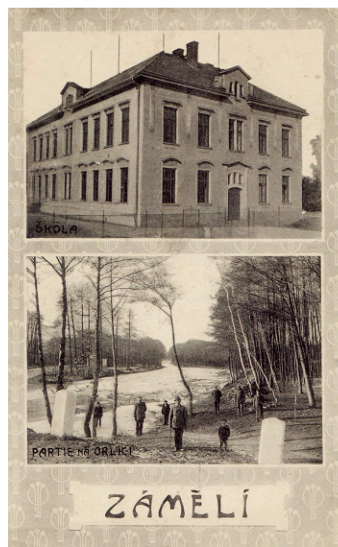
Na pohlednici z roku 1911 je použit název obce Zámělí.

Záměl měla také jako Potštejn a okolní místa svůj znak. Byl to kostelík