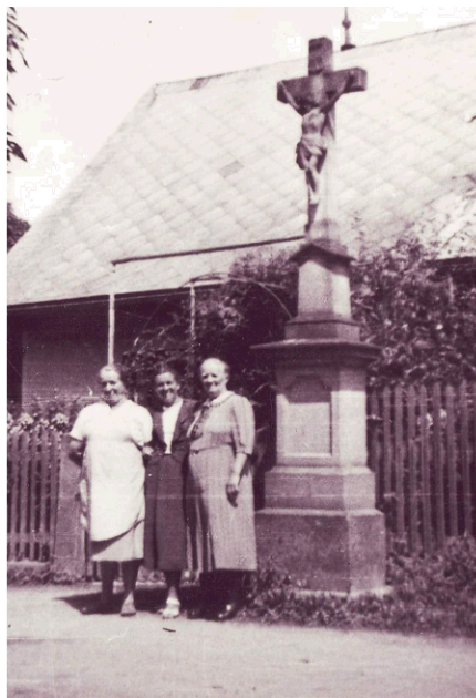
Původní kříž u domu č.p.89

73. Po levé straně silnice vedoucí k Vamberku, při cestě z „Halamek“ k „Borku“, na pozemku náležícím ke statku čp. 43, stál před 80 lety dřevěný kříž se zarámovaným obrázkem Madony s děťátkem. Obrázek byl v 60. letech 20. století opraven a umístěn na lípě u čp. 43. V dnešní době se na tomto místě již nenachází. 3/