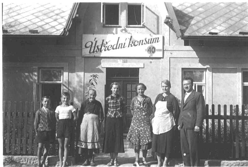
Ústřední konzum 40, soukromá fotografie majitele domu čp. 25.

Část obce hned za silnicí která tu tvoří hráz rybníka „Návesníka“. Jsou zde domy čp. 12, 18, 23, 24 a v roce 1928 tu byl v čp. 25 „u Konárků“ na hrázi uveden v činnost Dělnický konzum. 11/