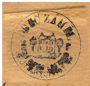
Zámělské obecní razítko používané v roce 1880