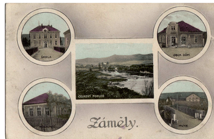
Kolorovaná pohlednice vzniklá mezi lety 1913 až 1915 uvádí název obce „Záměly“.