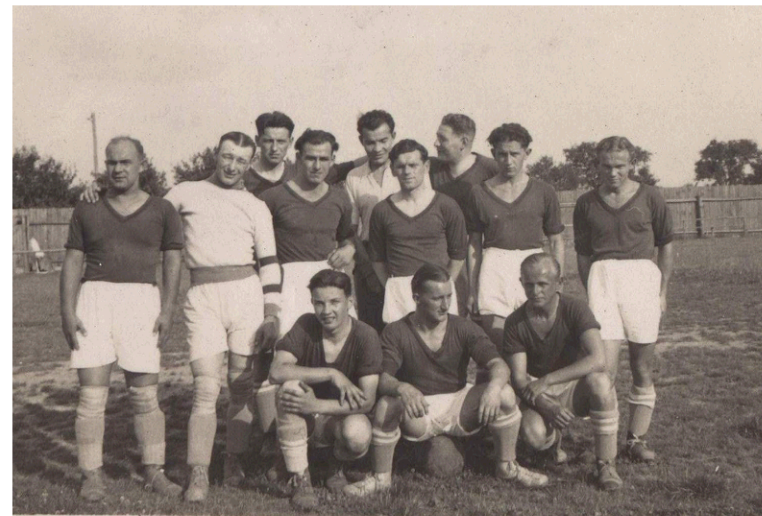
Zámělstí fotbalisté na soupeřově hřišti okolo roku 1935.

Hřiště zřídili sportovci pod kostelíkem sv. Marka roku 1933. Obec přispěla částkou 600 korun. Asi do roku 1938 se na tomto hřišti hrály okresní fotbalové zápasy. Dnes jsou zde různé akce zdejších hasičů, pořádají se tu dětské dny a místní mládež se sem chodí sportovně vyžít. 13/