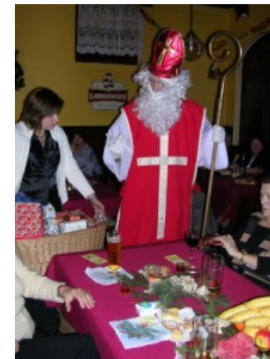
předvánočního posezení s důchodci