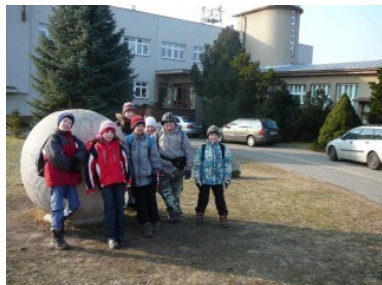
hvězdárna v Hradci Králové

V lednu navštívili budoucí prvňáčci své starší kamarády ve škole. Při hodině českého jazyka hledali písmenko, kterým začíná jejich jméno, vybarvovali je a povídali si o vystavených obrázcích. V den zápisu se pak nikdo nebál neznámého prostředí a předvedl své dovednosti paní učitelce. Zápisem prošlo 8 předškoláků. Rodiče dvou dětí požádali o odklad školní docházky. Po doložení požadovaných potvrzení jim byl vydán souhlas s odkladem školní docházky. Do první třídy tedy nastoupí 6 dětí.